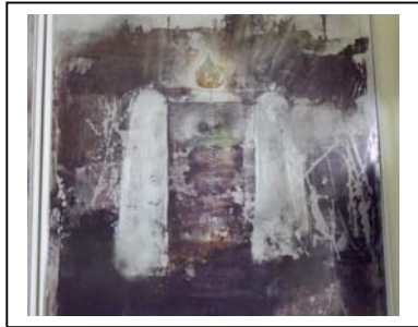
Ausschnitt, Aluminiumplatte, photobeschichtet, ergänzt mit Mischtechniken, 1993, zur Legende „Die Bestimmung des Punktes“

Eine aufregende Zusammenarbeit mit dem vielseitigen Künstler, gerade 30 Jahre alt, nahm ihren Lauf. Ein Jahr später fanden zwei 3-Tage-Ausstellungen statt: im September 1993 im „Kulturkeller“, Münchner Westend und im Oktober 1993 in der „Kulturwerkstatt Haus 10“, Fürstenfeldbruck, um Solodkij's „Bureau of Contemporary Research“ (BOCR-UnLTD) vorzustellen mit Zeichnungen, Objekten, Video-Installation und Forschungsergebnissen zum Projekt: „Game in Scientific Research of Ancient Russian/West Contemporary Art“ zu den ersten vier Legenden: