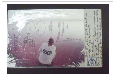
Einladungskarte zur „Legende vom El'ton Salt Sea“

Für die letzte BOCR-Legende lebte und arbeitete Evgenij Solodkij drei lange Monate mit seiner Crew in Kasachstan, einer einsamen und überirdisch schönen Märchenlandschaft am El'ton Salzsee in der Steppe auf der phantastischen Suche nach dem Gold der Skythen. Im Oktober 1997 kam er mit zahlreichen Ausstellungstücken nach Gauting für die „Legende vom El'ton Salt Sea“. Seine Forschungsarbeit dokumentierte er mit Videoaufzeichnungen, Fotos, Bildern, Skizzen-Büchern, Zeichnungen und „Salz-Skeletten“ von Skythen. Eine wunderbare Welt der Sagen.